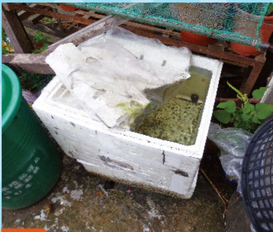
03 保麗龍盒、紙盒、餅乾盒