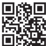
董氏基金會 華文戒菸網