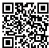
戒菸治療 管理中心